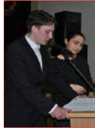
МБОУ СОШ №1 г.Ставрополя