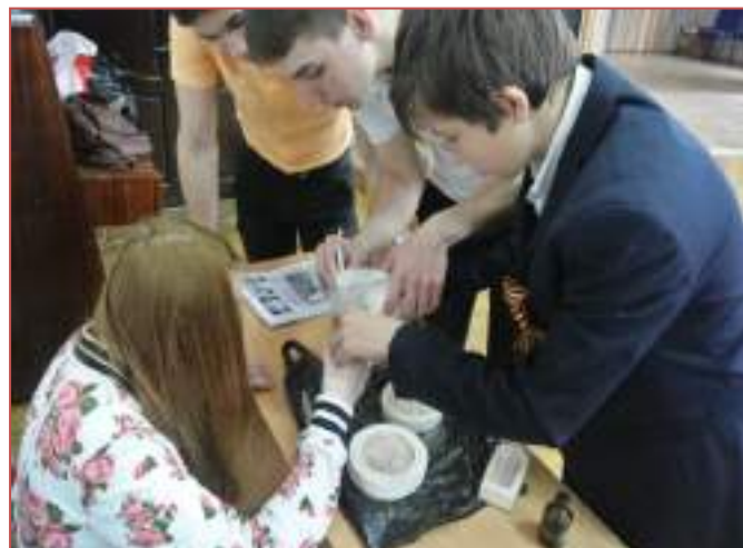
МБОУ лицей №8 г.Ставрополя