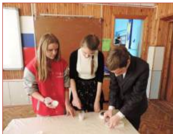
МБОУ СОШ №7 г.Ставрополя