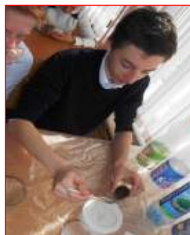
МБОУ СОШ №28 г.Ставрополя