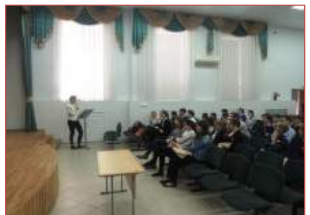
МБОУ гимназия №12 г.Ставрополя