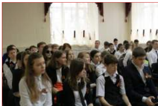
МБОУ СОШ №2 г.Ставрополя