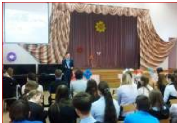
МБОУ СОШ №37 г.Ставрополя