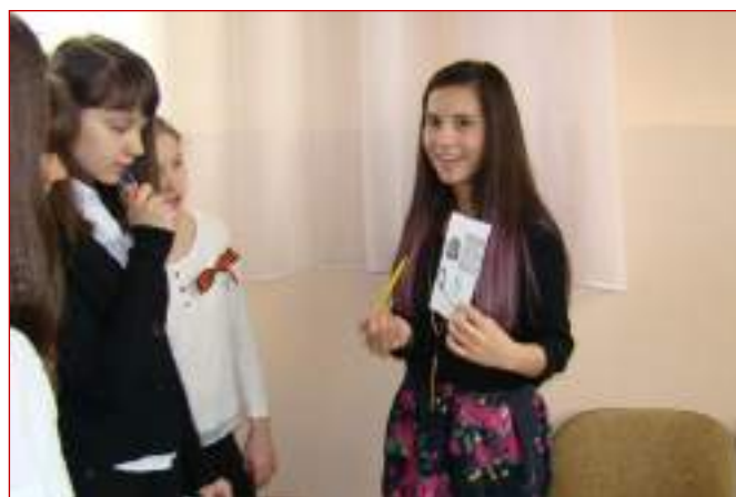
МБОУ гимназия №3 г.Ставрополя