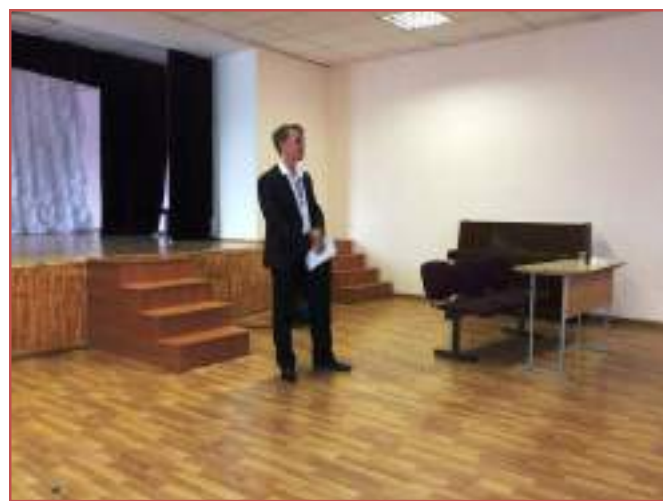
МБОУ СОШ №4 г.Ставрополя