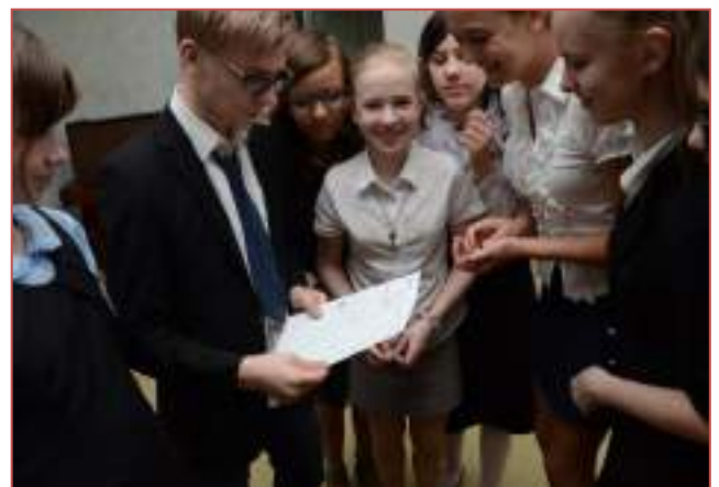
НОУ гимназия «ЛИК-УСПЕХ» г.Ставрополя