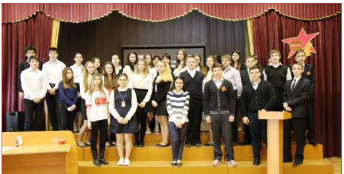
МБОУ гимназия №9 г.Ставрополя