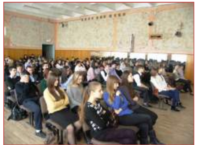
МБОУ лицей №23 г.Ставрополя