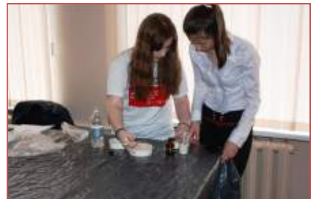
МБОУ лицей №16 г.Ставрополя