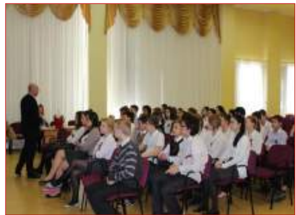
МБОУ СОШ №39 г.Ставрополя