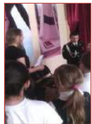
МБОУ гимназия №24 г.Ставрополя