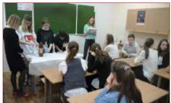
МБОУ СОШ №42 г.Ставрополя