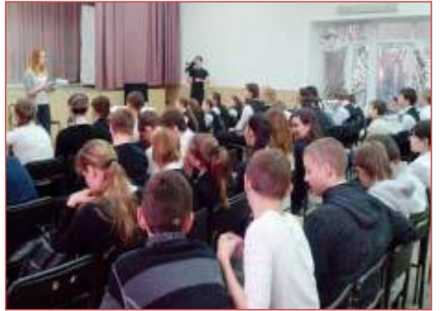
МБОУ СОШ №27 г.Ставрополя