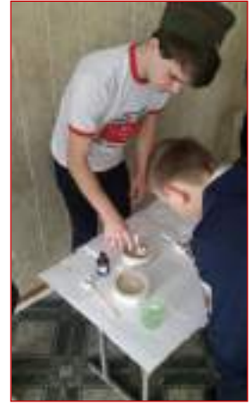
МБОУ СОШ №38 г.Ставрополя