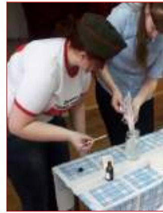
МБОУ СОШ №13 г.Ставрополя