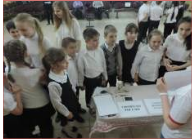
МБОУ СОШ №20 г.Ставрополя