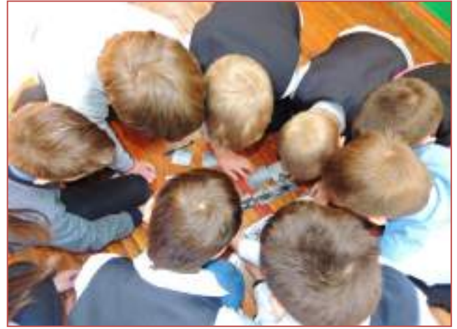
МБОУ СОШ №21 г.Ставрополя