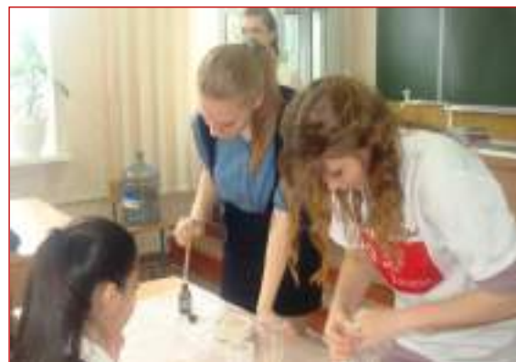
МБОУ СОШ №32 г.Ставрополя