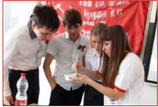
МОУ СОШ № 19 г.Ставрополя