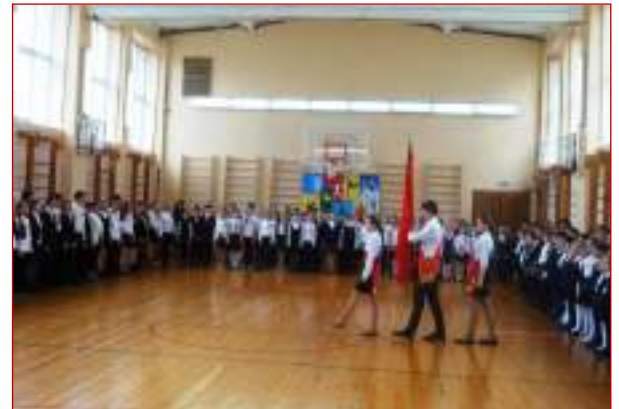
МБОУ лицей №14 г.Ставрополя