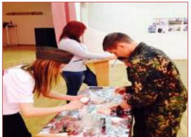
МБОУ кадетская школа им.генерала А.П.Ермолова г.Ставрополя