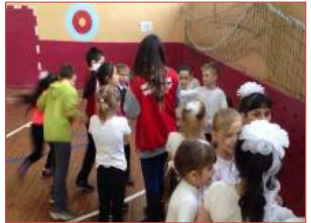
МБОУ СОШ №11 г.Ставрополя